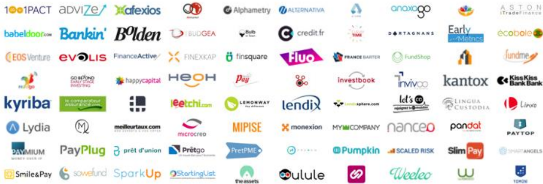
Les FinTech engagées avec La French Tech

Malgré le dynamisme des innovations proposées par les FinTech, les Français ne sont que peu au courant de ces nouvelles offres. Seuls 38% des Français déclarent connaître le financement participatif ou l'assurance habitation connectée.